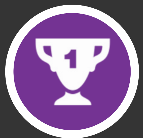
Centro de Memória e Documentação